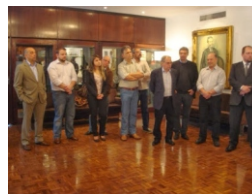
Entrega PEFS da FEE

Também foram aprovados os planos da Fundação de Proteção Especial (FPE) e da Fundação Gaúcha do Trabalho e Ação Social (FGTAS) em assembleias realizadas nos dias 4 e 5 de novembro, respectivamente. De acordo com o que foi acordado na Data-Base deste ano, os PLs serão enviados pelo governo à Assembleia Legislativa em regime de urgência, o que garante a sua votação ainda em 2013.